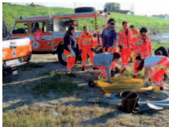
Due momenti dell'esercitazione mediante l'attivazione delle pompe idrovore