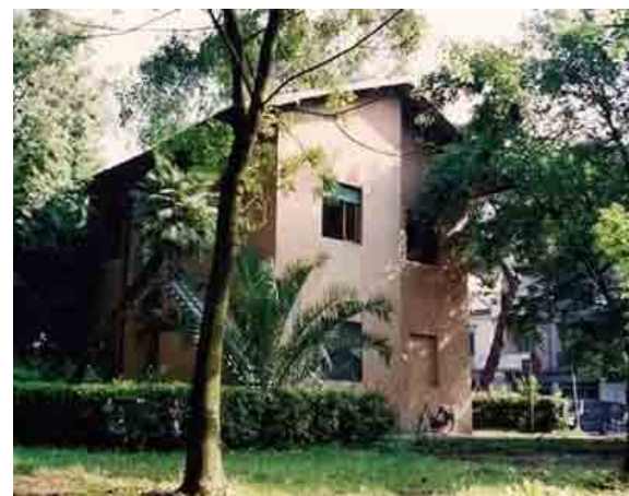
La sede della Casa delle Donne nel quartiere Marco Polo a Viareggio

Viareggio e le rappresentanti di altri centri antiviolenza nazionali. Lo scopo del Centro L'una per l'altra è quello di prevenire, contrastare e rimuovere le cause e gli effetti della violenza maschile sulle donne e sui bambini e bambine. È collegato, perciò, al numero ministeriale 1522 ed ha attivo il numero verde 800 800 811.