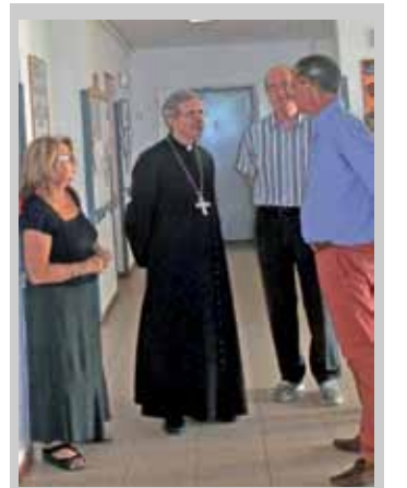
L'Arcivescovo di Pisa a Villa Ciocchetti