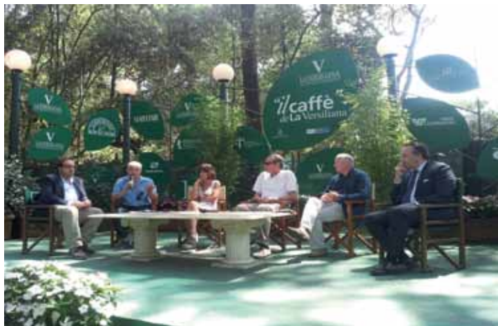
Un momento della conferenza stampa di presentazione del progetto "Benessere Cuore" - percorso di riabilitazione cardiologica, al caffè della Versiliana a Marina di Pietrasanta la scorsa estate. In alto: uno dei cartelli all'interno del parco che indicano due dei vari percorsi, "Scoiattolo" e "Testuggine".