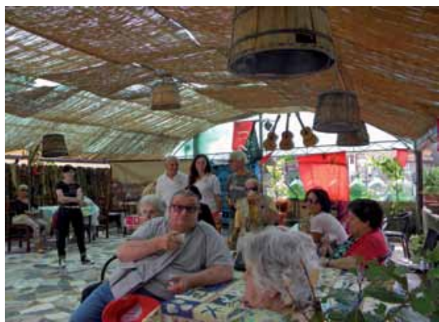
Ben riuscita e apprezzata la gita a Riomagnano durante l'estate