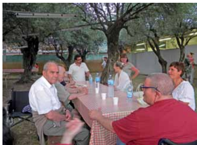
Si balla e si canta durante un momento ricreativo a Villa Ciocchetti