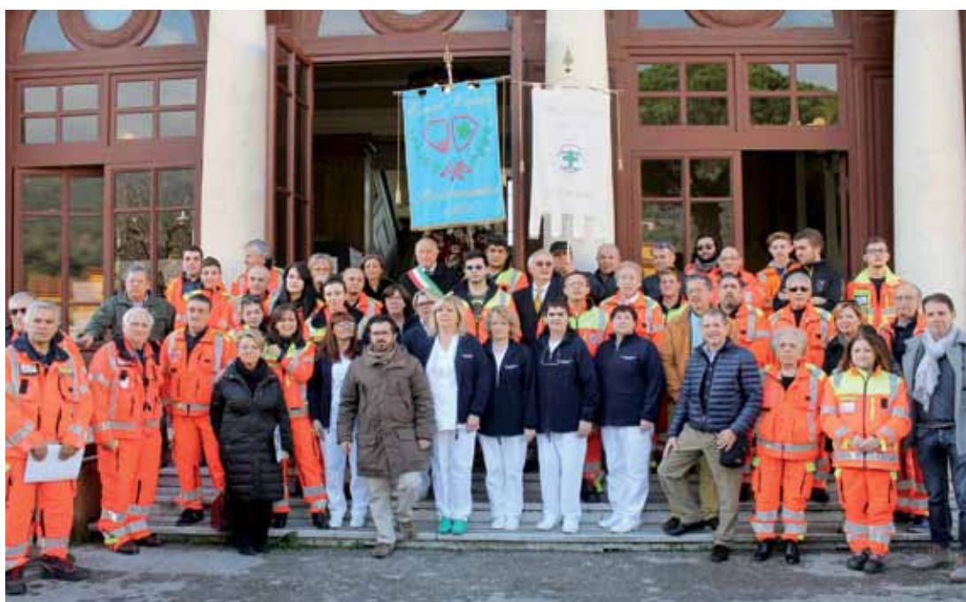
Riuscita la cerimonia di apertura del 20 dicembre

E' con l'auspicio di poter avere una Croce Verde sempre più all'altezza delle nuove sfide e ancora più vicina a chi ha bisogno di aiuto che ci congediamo dal 2014 fiduciosi di un 2015 ricco di risultati positivi e caratterizzato dalle tante iniziative che saranno prese per il Centocinquantesimo di fondazione dell'Associazione di Carità Croce Verde di Pietrasanta, la prima Pubblica Assistenza d'Italia.