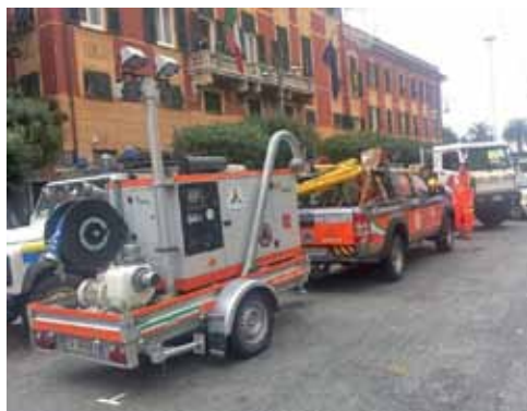
Alcune immagini dei soccorsi agli alluvionati della Liguria e per l'emergenza acqua a Pietrasanta che hanno visto impegnati i nostri volontari della Protezione civile

Tutto è cominciato all'alba di mercoledì 5 novembre: il fiume Carrione raccoglie la pioggia incessante che si è abbattuta nella zona. Trascina metri e metri cubi di acqua fino a rompere in via Argine Destro. Sono le prime ore dell'alba e si scatena l'inferno. E' un miracolo che alla fine la popolazione sia incolume. Intanto, a sera si contano 450 sfollati e 1.600 case danneggiate. Immediata la risposta del nucleo operativo di Protezione Civile