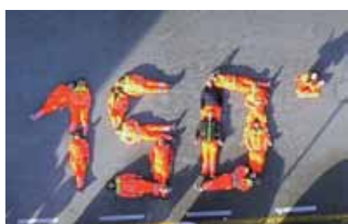
Volontari formano a terra il "150°". Sotto: la mostra di bozzetti dello "Stagi"