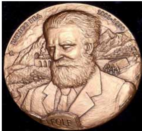
Medaglia commemorativa di Enrico Pea, coniata nel 2008 nel Cinquantenario della morte.

Temi dell'annullo filatelico speciale battuto durante le mostre sono stati: le Pievi Romaniche in Versilia, la Resistenza, il Parco delle Apuane, l'Europa; e, negli ultimi anni, personaggi storici come Carducci, Dunant, i Curie, Verdi, Pea, Gagarin, Marconi al centro anche delle mostre filateliche. Il Gruppo collabora con diversi altri circoli e comitati in concomitanza con manifestazioni o eventi di particolare rilievo. Così lo scorso anno è avvenuto per le celebrazioni del 500° Anni-