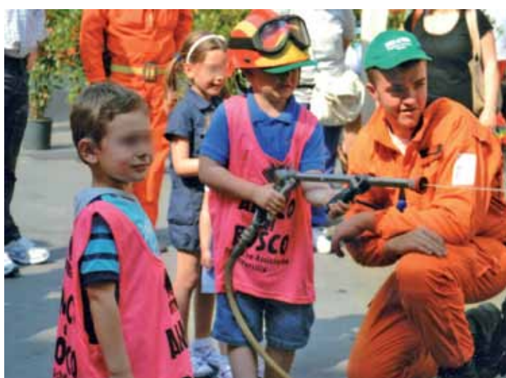
Impegnati i volontari della Croce Verde

La "cosa" cominciò a prendere corpo nel giugno di quest'anno quando, sin dal primo colloquio avuto con il preside Sandro Orsi dell'Istituto Comprensivo 1, emerse subito un favorevole e convinto accoglimento della no-